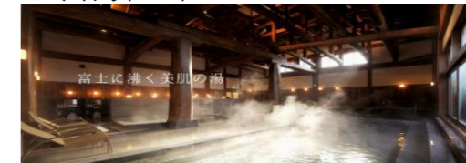
館内施設 ふじやま温泉