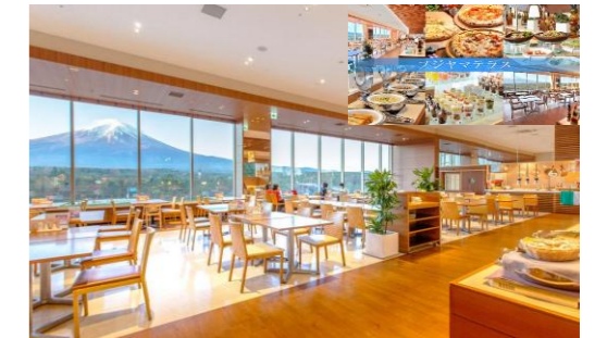
FUJIYAMA テラス レストラン(172席)