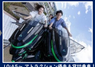
10:45～アトラクション優先＆貸切乗車！ ※雨天等でコースターが運休の場合は 代替のアトラクションへご案内します。