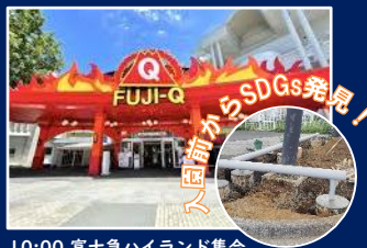
10:00 富士急ハイランド集合