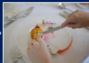
テーブルマナー講座