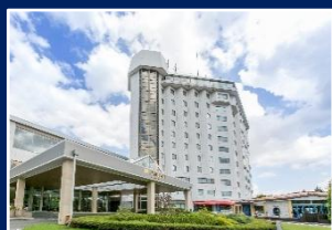
10:45 ハイランドリゾート ホテル&スパ集合

FUJII-Qセミナーや富士急ハイランドと 組み合わせてのご利用もおすすめです！