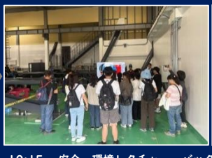
10:15～安全・環境レクチャー・バックヤード見学 ※見学可能なアトラクションは日程により異なります。