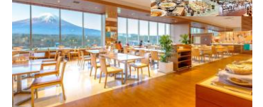
FUJIYAMA テラス レストラン(172席)