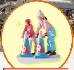
スケート補助具Qスケ